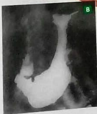
Fig. 2-5. Esquema de la estructura del estómago (A) y su radiografía (B). Este órgano tiene forma de J y cuando está vacío es tan pequeño como una salchicha, aunque al distenderse puede contener una enorme cantidad de alimentos.